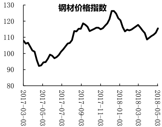
图 1 钢铁行业主要指标